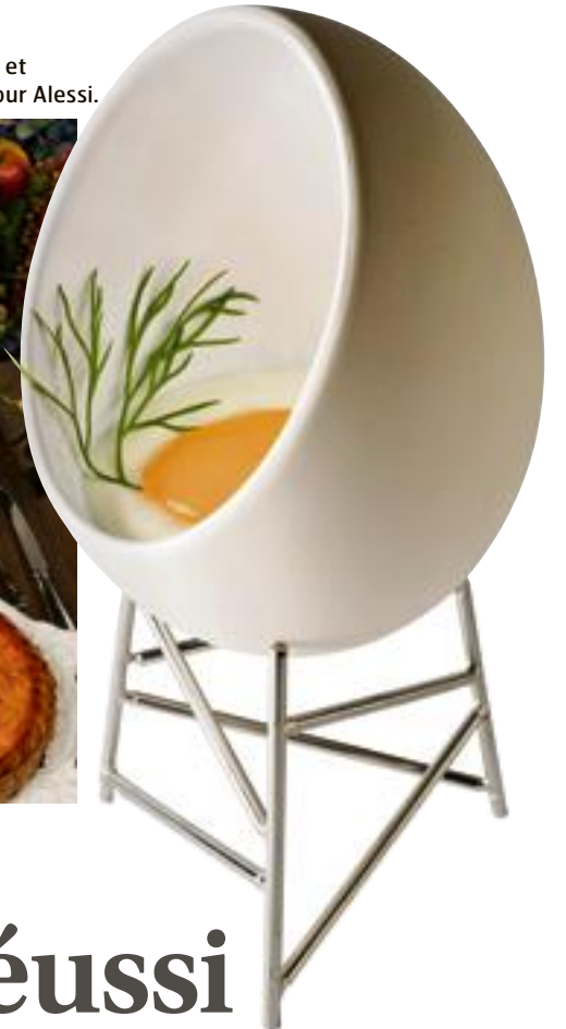
Ramequin Le Nid de Christian Ghion et Pierre Gagnaire pour Alessi.