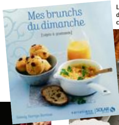
Livre « Mes brunchs du dimanche » chez Solar.