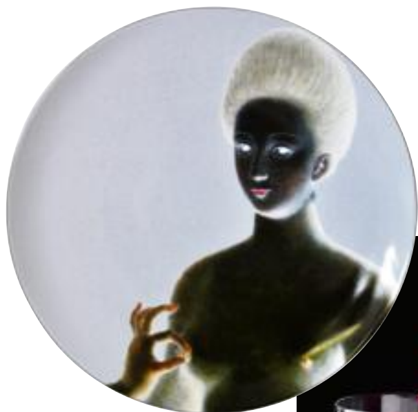
Assiette Gabrielle d'Estrées de Bernardaud.

LE JEU VIDÉO Hell Yeah! par Arkedo (Xbox Live Arcade, PlayStation Network, Steam) Un jeu de plate-forme déjanté, avec pour héros un lapin mort et ses envies de vengeance... Une pépite pour les fans de second degré, créé par un studio français.