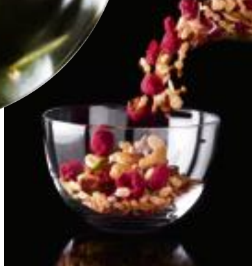
Granola Ispahan de Pierre Hermé.