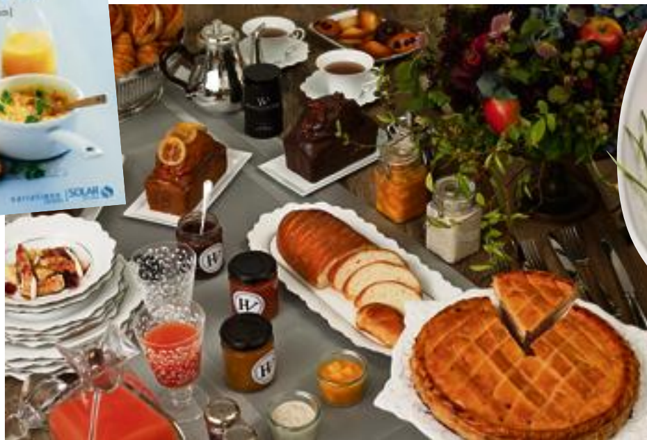
Le brunch sur mesure d'Hugo & Victor.